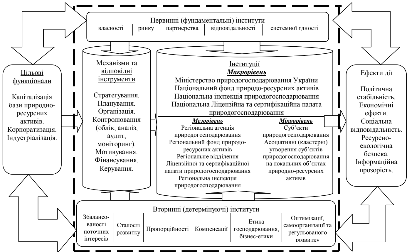
Рисунок 5 – Інституційне середовище природогосподарювання в Україні

– ефекти дії, які відображають дієвість синергічної інтеграційної взаємодії первинних та вторинних інститутів природогосподарювання через результативність запровадження відповідних механізмів та інструментів.