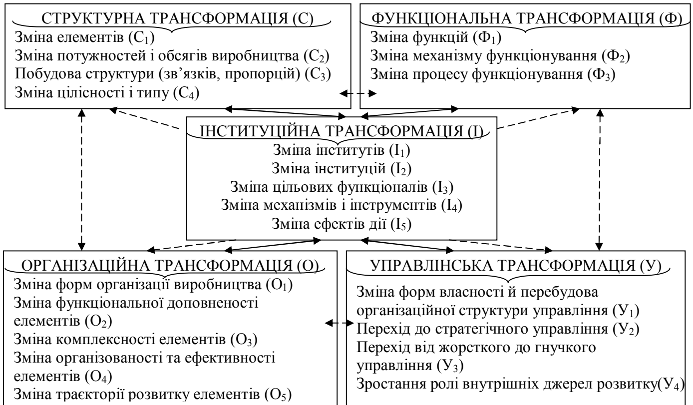
Рисунок 3 – Типологія та системні взаємозв'язки трансформаційних процесів у сфері природогосподарювання

критеріїв: «цілі розвитку природогосподарської системи → інноваційні орієнтири розвитку → доступність ресурсів для досягнення цілей, що забезпечує множину альтернативних варіантів перспективних напрямків інноваційного розвитку» систем природогосподарювання, а саме: за стратегічною спрямованістю, за масштабами, за терміном реалізації, за сферою застосування.