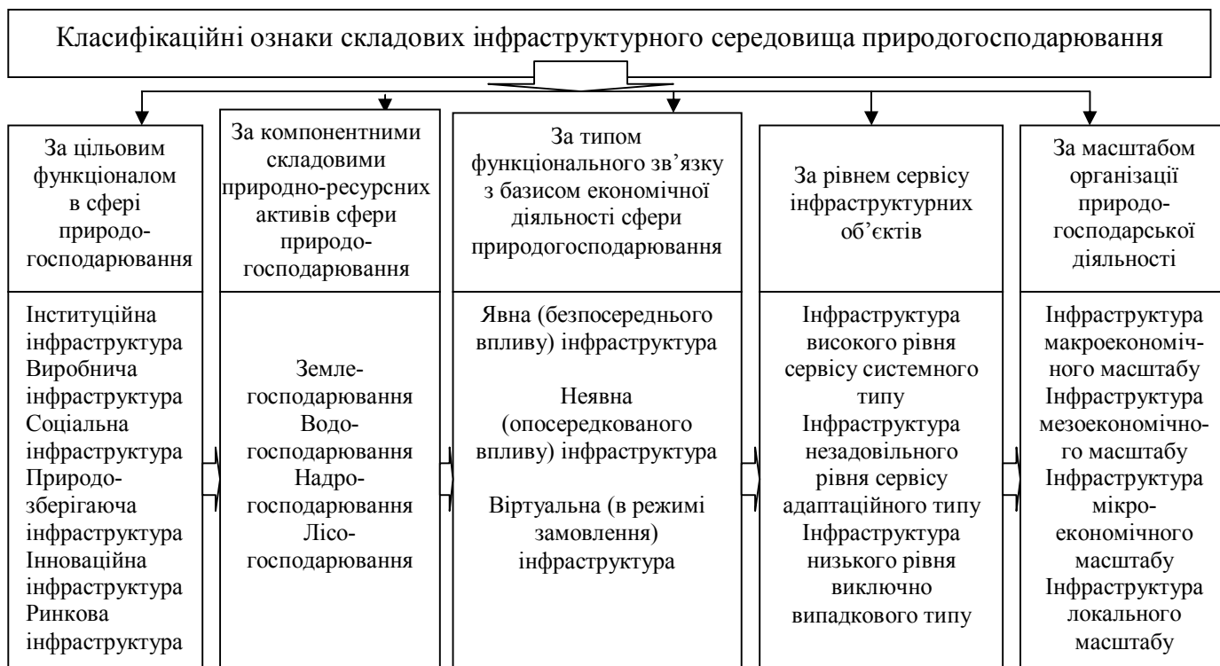
Рисунок 6 – Функціонально-компонентна модель інфраструктурного середовища розвитку природогосподарювання