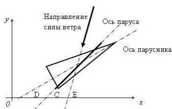
Рис. 2. Расчетные оси системы управления галсами

Во время движения плоскость расположения парусов парусника образует некоторый угол C с осью Ox специально расположенной [2] системы координат (рис. 2).