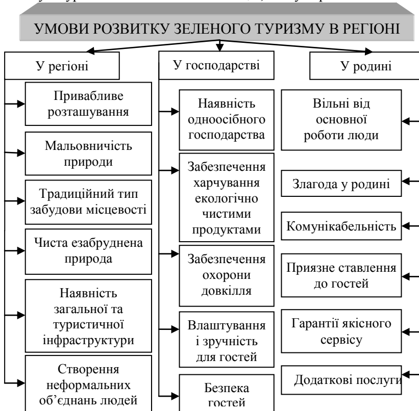
Рис. 2. Основні умови активізації розвитку зеленого туризму в регіоні

нують різноманітний відпочинок: верхові прогулянки, екскурсії до катакомб, дегустацію у винному льосі, дитяче містечко та багато іншого. Асоціація фермерів «Придунав'я» запрошує до унікальних куточків природи Ізмаїльського району Одеської області, відвідати біосферний заповідник, систему озер, познайомитися з не повторною культурою і звичаями багатьох націй, які тут проживають.