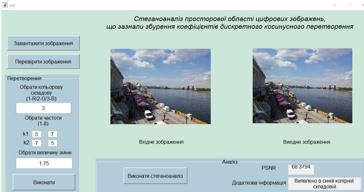
Рис. 2. Інтерфейс програмної реалізації стеганоаналітичного алгоритму

Для виконання стеганоаналізу ЦЗ та дослідження впливу змін коефіцієнтів ДКП на просторову область ЦЗ в середовищі в MATLAB було реалізовано програмний інтерфейс, представлений на рис. 2.