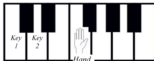
(а) фрагмент алгоритма обработки событий объекта-спрайта Hand (б) фрагмент экрана виртуального пианино