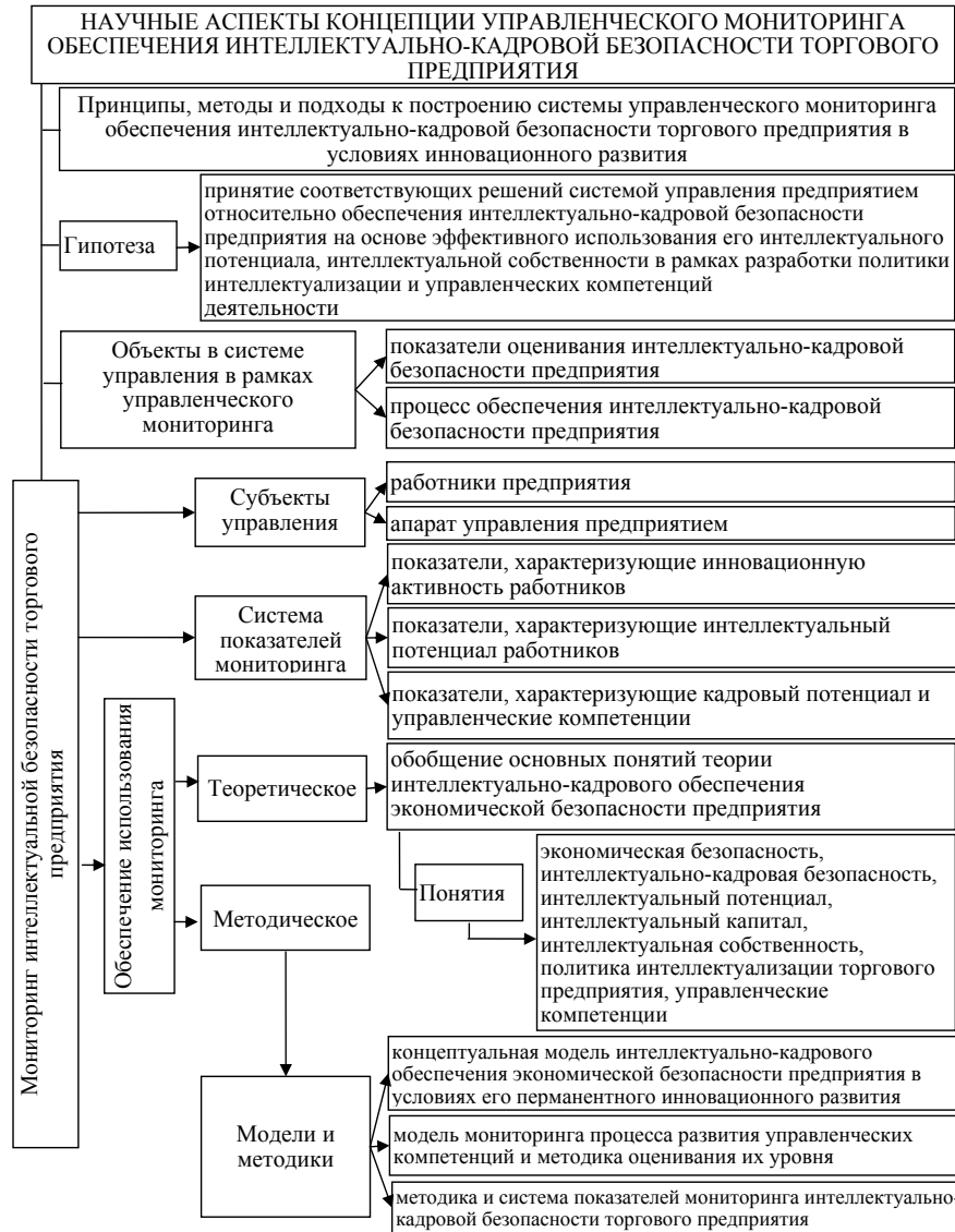
Рисунок 2 Научные аспекты управленческого мониторинга интеллектуально-кадровой безопасности торгового предприятия

Следовательно, управленческий мониторинг обеспечения интеллектуально-кадровой безопасности рассматриваемого предприятия ЧП ТФ “АНТОШКА” в условиях его перманентного инновационного развития предлагается проводить на основании использования следующих требований, условий и ограничений: