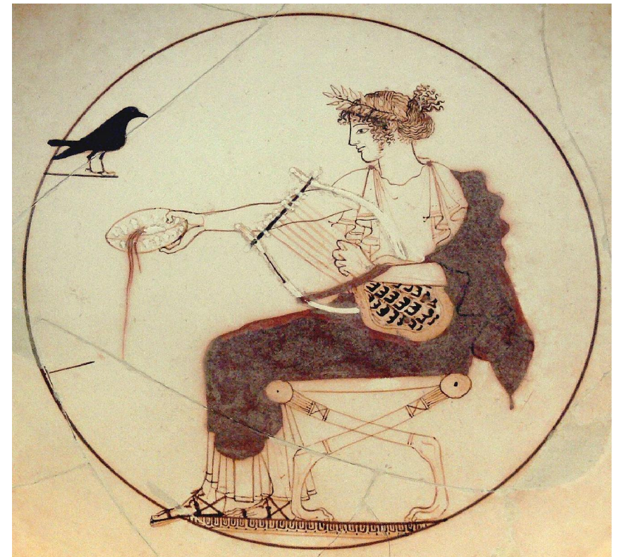
Фрагмент килика с изображением Аполлона и ворона из Национального археологического музея в Дельфах.

Такая близость выводов Гвидо к мыслительным конструкциям