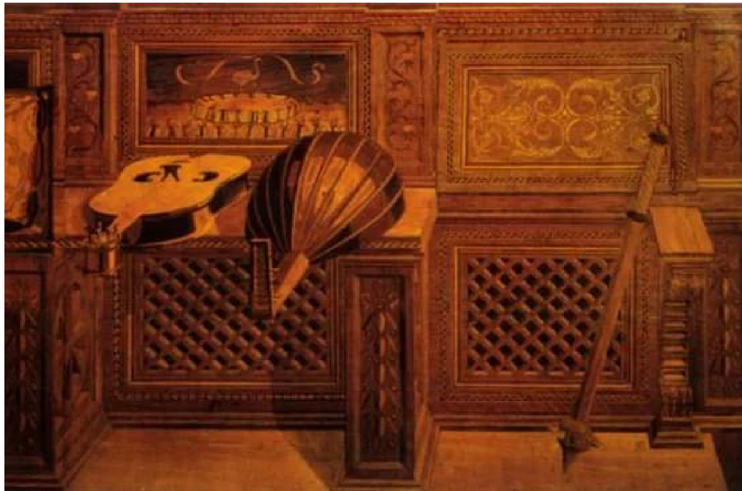
Интарсия. Фрагмент декоративного убранства Студиоло Федерико да Монтефельтро в Палаццо Дукале в Урбино.

Способен на грабеж, измену, хитрость» [12, с. 300].