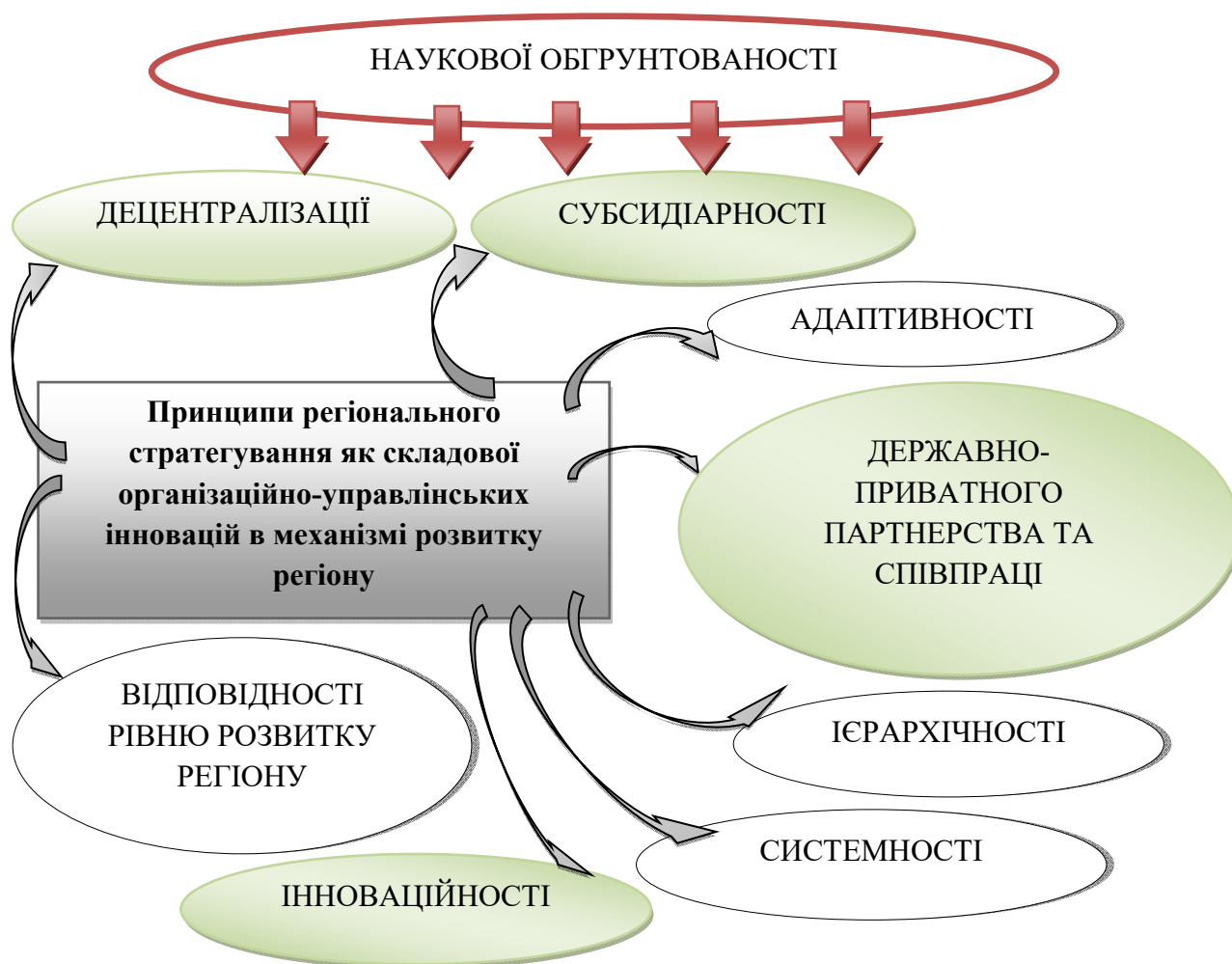
Рис. 2. Методологічні принципи стратегування соціально-економічного розвитку регіонів України

як один з основних механізмів стримування централізації [10]. В загальному розумінні, субсидіарність передбачає процедуру розподілу та перерозподілу повноважень між різними рівнями управління державної влади.