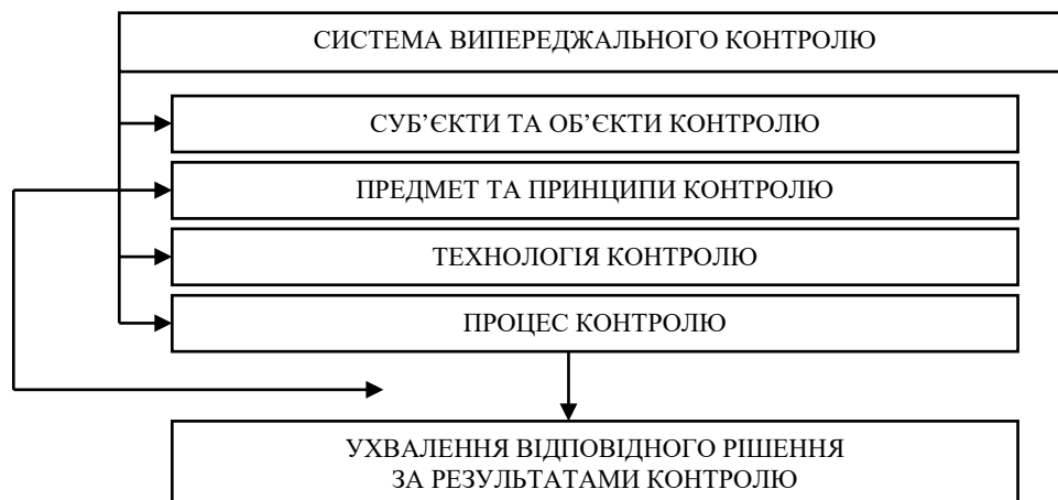
Рис. 3. Складові системи випереджального контролю та їх взаємозв'язок

підприємств та організацій національної економіки країни. Предметом випереджального контролю є система фінансових відносин, яка виникає в процесі функціонування об'єктів щодо отримання, розподілу або застосування ресурсів.