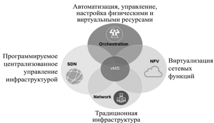
Рис. 2 – Совмещение технологий оркестрации, SND, NFV и традиционной ИТ-инфраструктуры в vMS

Надо отметить, что подходы к представлению сервисов существовали на ИТ-рынке и до появления технологий виртуализации [7–10], но благодаря им получили возможность эволюционировать в концепцию vMS. Соответственно появилось понятие Service Provider, которое постепенно вытесняет другое понятие – Telecom/Internet Provider. Таким образом, концепция vMS органично выросла из технологий SDN (Self Defined Network), NFV (Network Function Virtualization) и технологий оркестрации виртуальной инфраструктуры [11], под которой понимается технология автоматизации разворачивания и настройки виртуальной среды, в соответствии с конкретными требованиями. Технологии SDN позволяют консолидировать всю логику принятия решений по работе сетевого оборудования в одной точке, что, в свою очередь, позволяет получить более полный контроль над инфраструктурой, а NFV дают возможность создавать виртуальные сетевые элементы, для выполнения узконаправленных задач (фильтрация, мониторинг и изучения пользовательского трафика, антивирус). Ранее одно физическое устройство могло выполнять несколько функций, сейчас с помощью NFV появилась возможность разграничивать сетевые функции на необходимое количество виртуальных устройств, что позволяет упростить схему подключения и устранить аппаратные сбои.