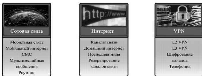
Рис. 4 – Услуги современных телеком-операторов

Сегодня наибольшее распространение получили три основных вида услуг: сотовая связь, интернет, VPN доступ (рис. 4).