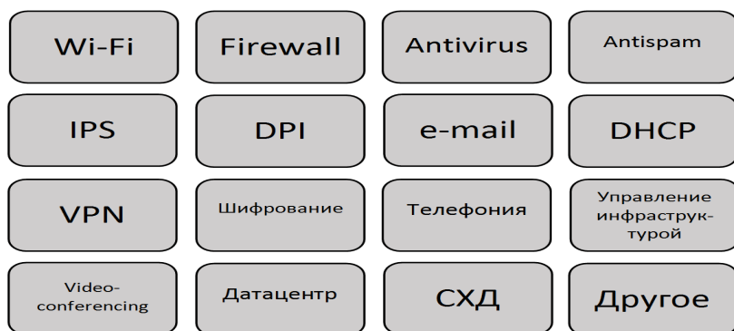
Рис. 3 – Примеры ИТ-сервисов

обеспечивается ИТ-инфраструктурой. Например, возможность печатать на сетевом черно-белом принтере – это ИТ-сервис (назовем его «Basic Printer Access»). Если пользователь, является руководителем определенного уровня, ему должен быть предоставлен сервис «VIP Printer Access» – доступ к цветному принтеру. Если пользователь – рядовой сотрудник, ему должны быть предоставлены сервисы: «Basic Printer Access» и «Plotter Printer Access» – печать на обычном принтере и на плоттере. Приведенный пример, хотя и весьма прост, тем не менее иллюстрируют сервисный подход к построению ИТ-инфраструктуры. Другие примеры сервисов изображены на рис. 3.