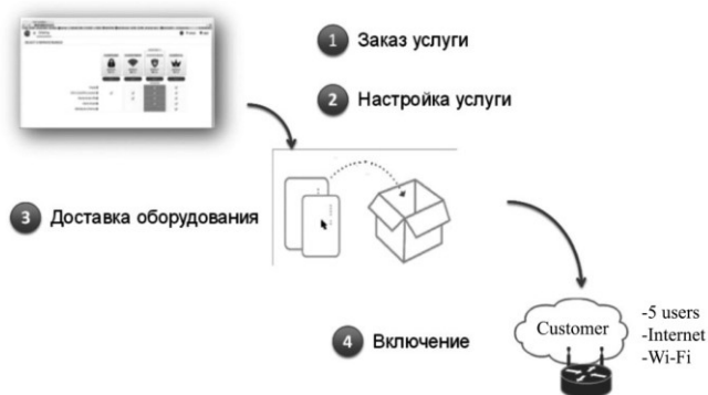
Рис. 6 – Алгоритм развертывания сервисов конечным потребителем

Шаг 4 – оборудование подключается к сети интернет, после чего можно использовать заказанные сервисы.