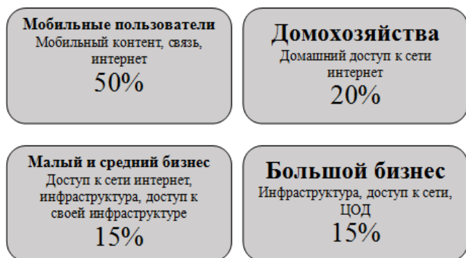
Рис.5 – Сегменты рынка телеком-провайдеров

В различных источниках оценки емкости и относительные доли рынка несколько отличаются друг от друга, но общая картина примерно такова, как на рис.5.