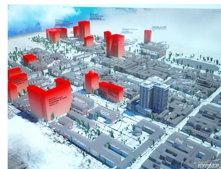
Рис. 4. Схема забудови

Керівництво міста продовжує подавати Одесу на статус ЮНЕСКО: перша номінація в ЮНЕСКО – це був центральний історичний ареал, який охоплював територію в межах порту і вулиць Старопортофранківській, Пантелеймонівській. Потім подавали тільки ту частину, звідки почалася забудова міста: вулиці Преображенська, Грецька і по Польської вниз до порту. Остання зона стала ще менше – сьогодні територія включає в себе вулиці Приморську, Військовий спуск, провулок Некрасова, Преображенську і Буніна. Але навіть там є квартал, що нещодавно став локацією для фото сесії у стилі «Джокер» через жахливий вигляд та подібність до Готему з всесвіту DC. Схоже, що це не зовсім те, що сподобається ЮНЕСКО.