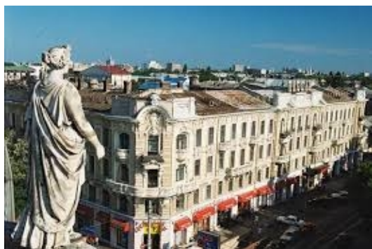
Рис. 1. Центр Одеси