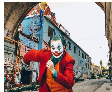
Рис. Джокер на Деволановському [Джокер, 2019]

Керівництво міста продовжує подавати Одесу на статус ЮНЕСКО: перша номінація в ЮНЕСКО – це був центральний історичний ареал, який охоплював територію в межах порту і вулиць Старопортофранківській, Пантелеймонівській. Потім подавали тільки ту частину, звідки почалася забудова міста: вулиці Преображенська, Грецька і по Польської вниз до порту. Остання зона стала ще менше – сьогодні територія включає в себе вулиці Приморську, Військовий спуск, провулок Некрасова, Преображенську і Буніна. Але навіть там є квартал, що нещодавно став локацією для фото сесії у стилі «Джокер» через жахливий вигляд та подібність до Готему з всесвіту DC. Схоже, що це не зовсім те, що сподобається ЮНЕСКО.