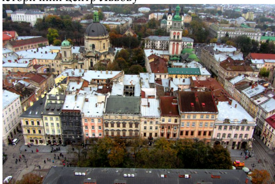
Рис. 2 Центр Львова

До речі, у Львові також були окремі проблеми, частина мешканців намагалися робити собі надбудови-мансарди, але у 2019 році Верховний суд Львова заборонив це. ( https://portal.lviv.ua/news/2019/09/11/verhovnyj-sud-zaboronyv-u-lvovi-robyty-nadbudovy-u-budynkah-bez-zgody-meshkantsiv )