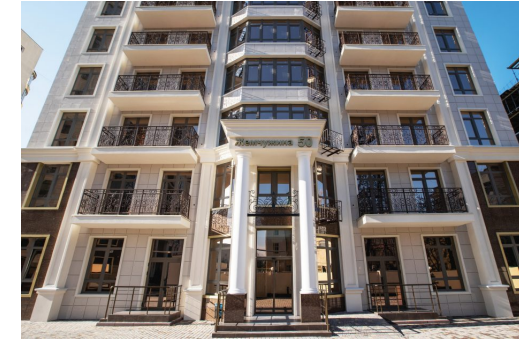
Рис. Перлини Кадорр Груп

поєднанням класичної архітектури та інноваційних технологій, які забезпечать естетику і максимальний комфорт для майбутніх мешканців будинку», – зазначено в рекламі. [50 перлина, 2019]