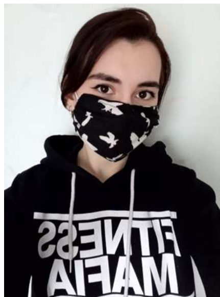
Рис. 2. Багаторазова захисна маска, зроблена власноруч

Звісно ж, за таких умов мало хто захоче шити маску під стандартну – білу або бліденько-блакитну. Шухляди зі старими речами надали більш широкого простору для варіацій «маскової естетики». Пошити (або придбати вже готову) багаторазову маску із тканини можна було на будь-який смак і колір, до будь-якого костюму: чорну під строгий діловий імідж (або під образ гота чи рокера), рожеву під гламурну сумочку або шарфік, з квітастим принтом під літній сарафан тощо. А можна пошити універсальну маску, яка пасувала би до будь-якого одягу. Наприклад, чорна маска із білими пташками (рис. 2) може бути доречною у більшості гардеробів сучасної молоді.