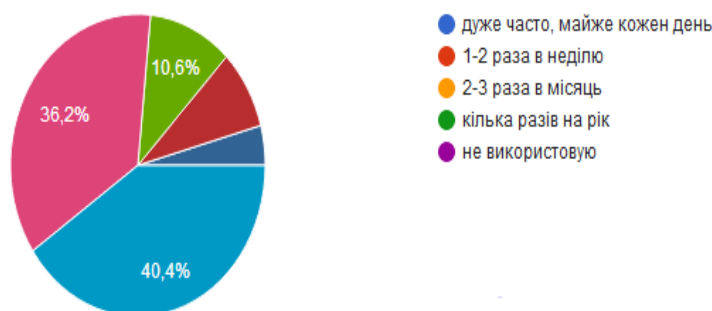
Рисунок 2 – Зведена діаграма частоти використання велосипеда

В основному для пересування по місту, опитані нами респонденти, використовують маршрутки, трамваї, тролейбуси і власні автомобілі і тільки 14,9% респондентів, а це 7,2% використовують велосипед як транспорт для пересування (рис. 3).