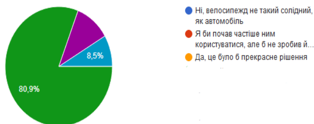
Рисунок 4 – Діаграма зміни транспорту

Найбільш важливим мотивом для респондента, який спонукав би його, поміняти свій звичний вид транспорту на велосипед, це економія коштів. Далі йде спорт, економія часу і турбота про екологію. Провівши дисперсійний аналіз, ми перевірили кілька гіпотез і можна сказати, що: