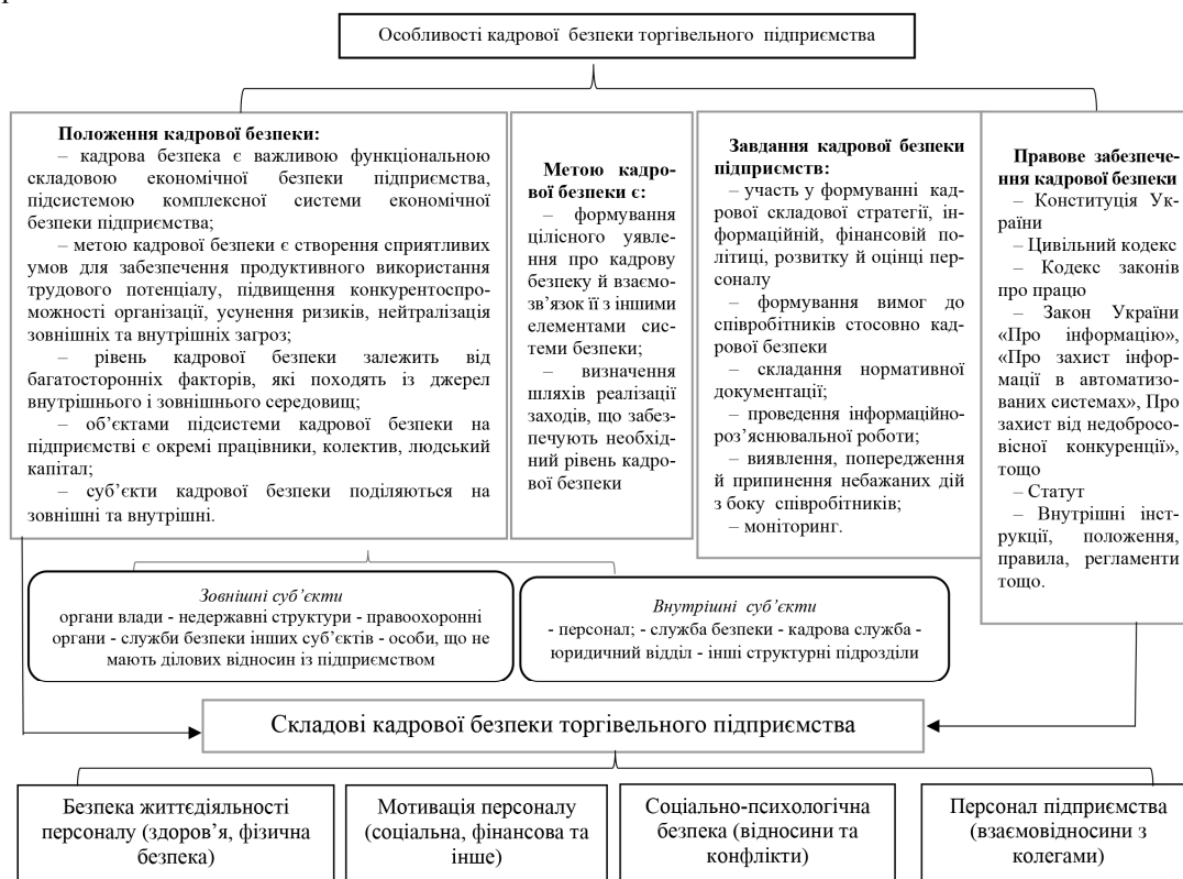
Рис. 1. Особливості та складові кадрової безпеки торговельного підприємства [розроблено на засадах [1,2,3]]

Тому необхідно розробити рекомендації організаційного характеру, що дозволять комплексно здійснювати управління кадровою безпекою на торговельному підприємстві, з метою стабілізації та покращення стану наведеної системи. Організаційні інструменти управління узагальнено за складовими кадрової безпеки наведені на рис. 3.