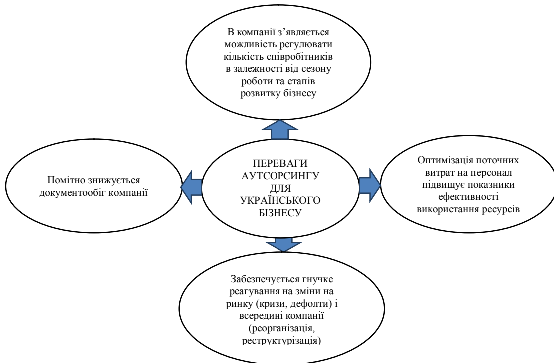
Рисунок 2. Переваги аутсорсингу для українського бізнесу

Можемо виділити наступні переваги аутсорсингу для українського бізнесу (рис. 2).