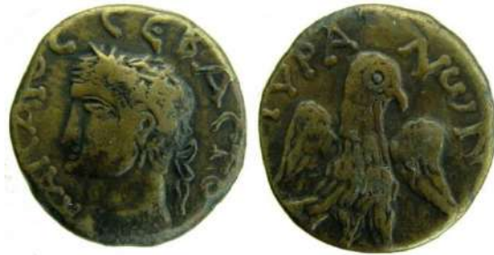
Рис. 3. Тіра, тетрасарій, I ст. н. е.. МГ НБУ. Інв. № КН-3532.

Неодноразово підкреслювалось, що тетрасарій Тіри є рідкісним (Рис. 3). Владленом Опанасовичем було вказано, що монет цього типу йому відомо не більше 10 одиниць, подібна зберігається в Одеському археологічному музеї, Державному Ермітажі та Державному історичному музеї в Москві, натомість запропонований екземпляр на думку фахівця переважав аналогічні за станом збереженості. Відповідно до зазначених критеріїв рідкості та відмінного стану збереженості, грошову оцінку монети Тіри було визначено у 1000 гривень, другою за вартістю монетою з підбірки став сестерцій Нерона (54-68 рр.) (Рис. 4) з портретом імператора, а також боспорський обол царя Асандра (Рис. 5).