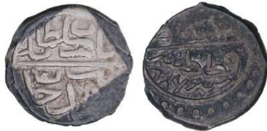
Рис. 7. Османська імперія, Баязид II (1481-1512), акче 886 АН карбування Костантініє (Стамбул). МГ НБУ. Інв. № КН-3549.