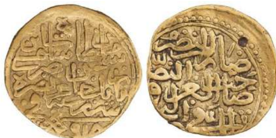
Рис. 8. Османська імперія, Селім I (1512-1522), султані (алтун) 918 АН карбування Місір (Каїр, Єгипет). МГ НБУ. Інв. № КН-3551.