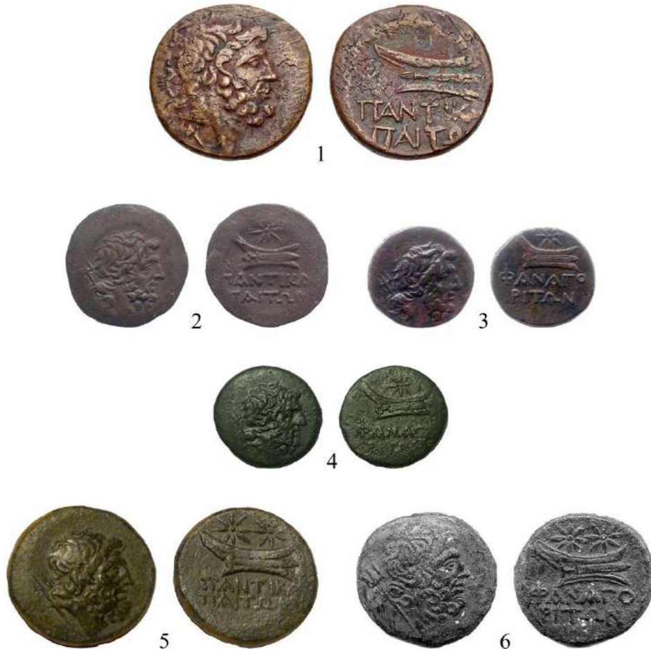
Рис. 1. Оболы Пантикапея и Фанагории с бюстом Посейдона на аверсе и с кораблем и мечом на реверсе: 1 – первой серии; 2-4 – второй серии; 5, 6 – третьей серии (по bosporan-kingdom: 1; bosporan-kingdom: 2; bosporan-kingdom: 3; bosporan-kingdom: 4; bosporan-kingdom: 5; bosporan-kingdom: 6).

в правой руке на аверсе и с плывущим влево боевым кораблем 9 , на который наложен длинный и широкий обнаженный меч острием назад на реверсе. Эти монеты интересны как оригинальностью идеи оформления, так и тем, что изображения на них претерпели значительную эволюцию. Начнем с того, что на корпус корабля на их реверсе наложен меч. Что не свойственно прочим выпускам Боспорского государства 10 . Причем на монетах на рис. 1: 1–4 его ручка выступает за нос, а на прочих экземплярах (рис. 1: 5, 6) она аккуратно вписана в пределы судна. Примечательно и то, что на бронзах на рис. 1: 1–4 у Посейдона короткая и кудрявая борода, а на прочих выпусках она у него длинная и лохматая (рис. 1: 5, 6).