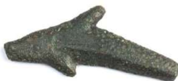
Рис. 1. Ольвія, дельфін V-II ст. до н. е. МГ НБУ. Інв. № КН-3504 Елементний склад 1 : Fe – 0.454%; Co – 0.021%; Ni – 0.139%; Cu – 85.922%; Zn – 0.118%; As – 0.033%; Sn – 13.04%; Pb – 0.276%.

Нами також досліджено елементний склад ольвійського дельфіну (Рис. 1), після проведення двох вимірювань на аверсі та реверсі встановлено, що його виготовлено із однорідного металу – олов'янистої бронзи із природніми мікро-домішками, особливістю якого є наявність незначного вмісту кобальту.