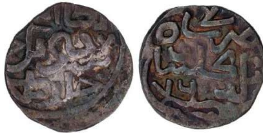
Рис. 6. Золота Орда, Кульна (Кульпа), данг 760 АН карбування Гюлістану. МГ НБУ. Інв. № КН-5463

Східні монети представлені мідними пулами Золотої Орди та срібними дангами хана Кульни (Кульпи) (1359-1360), карбованим у місті Гюлістані у 760 АН (Рис. 6), а також дангом хана Кільдібека (1361-1362), карбованим в Азаку у 763 АН. Продовжують підбірку ісламські монети – срібні акче Османської імперії, карбовані за часів султана Баязида II (1481-1512) монетного двору в Костантініє (сучасний Стамбул) у 886 АН (Рис. 7).