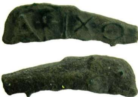
Рис. 2. Ольвія, дельфін із легендою «ΑΡΙΧΟ». МГ НБУ. Інв. № КН-3506.

Усього фахівцем з античної нумізматики Владленом Опанасовичем Анохіним було запропоновано викупити 53 монети, з яких: