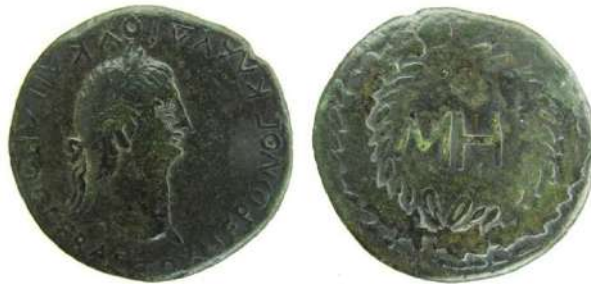
Рис. 4. Боспорське царство, сестерцій 63-68 рр. із портретом Нерона, МГ НБУ. Інв. № КН-3529.