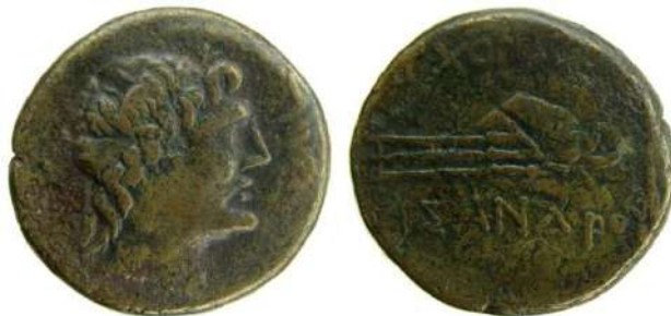
Рис. 5. Боспорське царство, Асандр, обол 50/47 рр. – 17/22 рр. до н.е. МГ НБУ. Інв. № КН-3527.

Монети Римської імперії серед запропонованих В. Анохіним визначено денаріями II-III століття (монетами Антонія Пія (138-161), Фаустіни Старшої (141 р.), Марка Аврелія (161-180) та Фаустіни Молодшої (161-176)), особливу увагу серед яких привертав денарій Септимія Севера (193-211). Рідкісними монетами із запропонованих стали також майорина Херсонесу часів Лева I (457-474) та майорина Зенона (474-491).