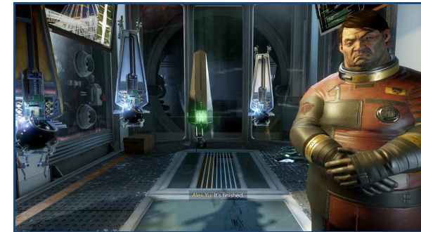
Рис.3 "Оператори та Алекс Ю судять тифона."

Вся гра виявилася розширеною збіркою тестів з проблеми вагонетки, в яку помістили гравця. І в кінці значущим був не дійсний результат, а рішення і емоції піддослідного.