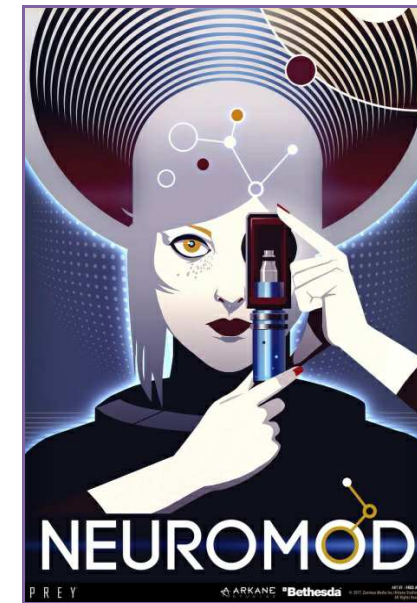
Рис. 1 «Постер присвячений нейромоду.»

На головному герої проводився експеримент за впливом нейромодів на людину, проте видаливши їх, Морган Ю, один з директорів компанії, зіткнувся з побічним ефектом: стирання пам'яті до моменту впровадження першого нейромоду.