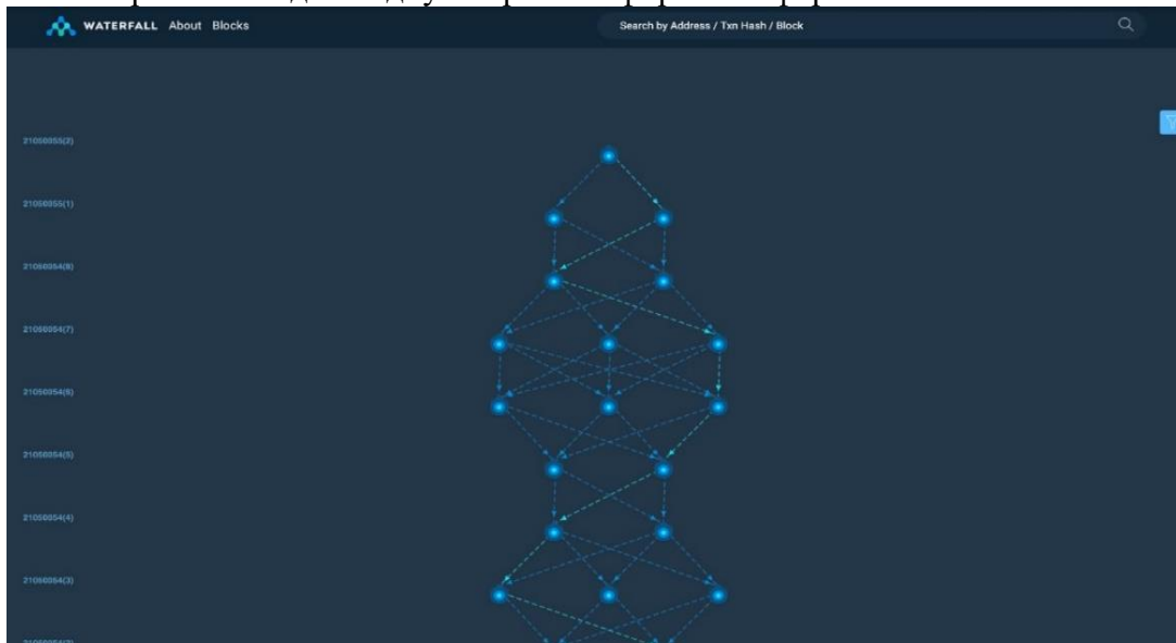
Рис.2. Екран виведення результуючого лінійного топологічного впорядкування BlockDAG.

На рис. 2 наведено одну з екранних форм платформи Waterfall.