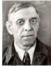
Курнаков Георгій Васильович (1887 – 1977)