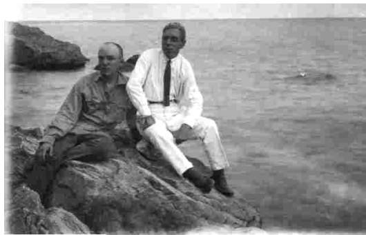
Рис.1. Курнаков Георгій Васильович в Криму, 1930-ті р.

З 1924 року Георгій Курнаков починає перші спроби живопису на лінолеумі (до цього використовував тільки заґрунтований картон). Використання лінолеуму в роботі було викликано тим, що картон важко дістати, але потім живопис на лінолеумі захопив настільки, що він майже відмовився від картону. На новому матеріалі художник писав без ґрунту, використовуючи «пастозні мазки». Мазки, майже однакові за величиною, лягали на основу не торкаючись один одного та створювали килим-мозаїку. Пізніше цей прийом живопису на лінолеумі називатимуть «килимовим». Такою технікою були написані полотна «Море у Скадовську» (1924), «Стара дзвіниця» (1924), «Руїни біля моря. Ялта» (1924), «Берег Дніпра» (1924), «Радісний весняний день» (1925), «Веселий травень» (1931), «Вечір» (1934), «У будинку відпочинку» (1935), «Після дощу» (1936) [1].