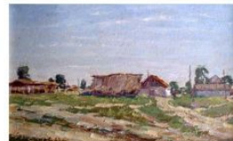
"За околицей", картрон, олія, 1967 р.