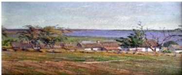
"Херсон, Монастырская слободка", картон, олія, 1962 р.