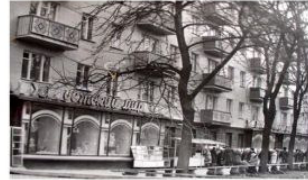
Будинок на проспекті Ушакова 26, де жив художник.

• Заслужений діяч мистецтв ЗРСР, 1967 р.