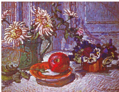
Рис.2. «Натюрморт з яблуком», 1937р

Паралельно з пейзажами пише натюрморти, кращі з них «Піони» (1935), «Натюрморт з яблуком» (1937), «Натюрморт» (1954) «Овочі» (1959), «Весняні квіти» (1961), «Рудбекія і гвоздика» (1963), «Рози» (1964) [1,7].