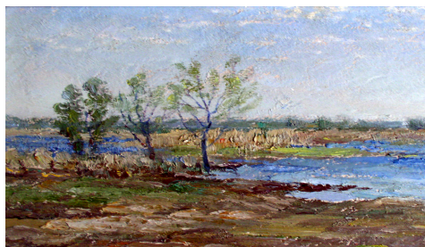
Рис. 6. «Весна у розпалі», 1960 р.