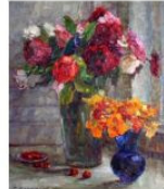
"Розы", холст, олія, 1964 р.