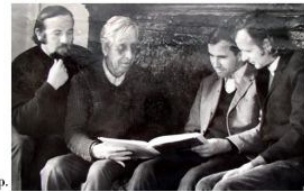
У майстерні художника, 1967 р.

• Персональні виставки: - Херсон, 1955 р., 1962р.; - Київ, 1956 р.; - Сьвйферополь, 1963 р.