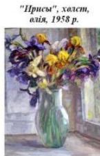
"Приси", холст, олія, 1958 р.