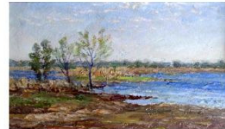
"Задумчивый осенний день", картон, олія, 1966 р.