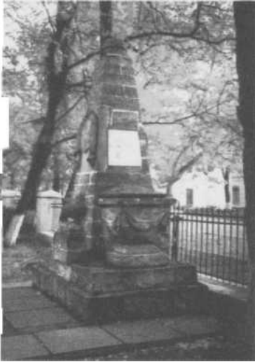
Рис.16. Могила принца Вюртембергского

сильно повлияла на душевное состояние Потемкина. Во время отпевания тела принца в галацкой церкви князь с поникшей головой вышел, не дождавшись окончания службы. Кучер траурной колесницы решил, что тело уже выносят, и подъехал к Потемкину. Князь в рассеянности даже сел на дроги (похоронная колесница без кузова). Этот случай произвел на мнительного светлейшего крайне тяжелое впечатление (князь скончался через два месяца)