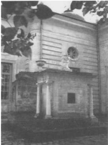
Рис.15. Могила генерал-аншефу И.Меллеру

Артобстрел крепости князь поручил командующему всей артиллерией Российской империи генерал-аншефу Ивану Меллеру. Немец по национальности, мещанин по происхождению, Иоганн Меллер начал службу в российской армии с 1740 года. Талантливый офицер стал сподвижником Потемкина. Когда взятие Очакова стало для светлейшего делом чести и признания его полководческого таланта, он срочно вызвал обрусевшего немца в Херсон. Совместно с Александром Суворовым Меллер составил план штурма Очакова. 6 декабря 1788 года генерал-аншеф Иван Меллер лично повел на штурм цитадели две воинские колонны.