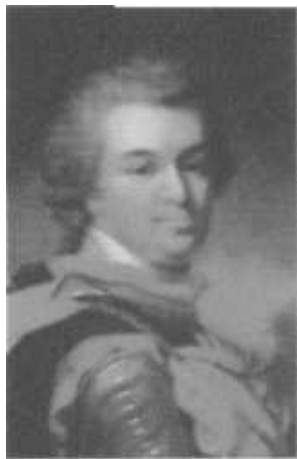
Рис. 1. Адмирал Алексей Наумович Сенявин

Екатерина II видела себя владычицей Черного моря. Мысленно она сравнивала себя со своим кумиром Петром I, открывшим «окно» для выхода России в Европу. Но вице-президент Адмиралтейств-коллегии граф И. Г. Чернышев остудил восторженность императрицы: ведь донская и азовская верфи не рассчитаны на строительство кораблей 60-пушечного ранга. Именно они могли реально противостоять турецкому флоту. - Так в чем же дело, граф? - раздраженно бросила Екатерина. - Ищите место строительства гавани, верфи, порта. Петр Александрович (Румянцев-Задунайский) и Алексей Григорьевич (Орлов-Чесменский) вон сколько земель у басурманов отвоевали!. Исполняя волю императрицы, Чернышев 27 августа 1775 года отправил командующему Азовской флотилией адмиралу Алексею Наумовичу Сенявину письмо-приказ: «...Исполняя волю государыни, Вам надлежит отправиться в Днепровский лиман и обследовать его побережье с целью выбора места для базы Черноморского флота и строительства гавани, верфи и поселения».