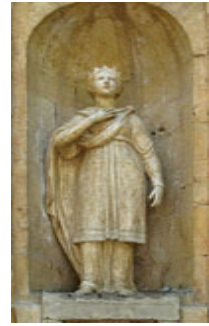
Рис. 6. Скульптурные работы скульптора Замаарева

ний, в частности, изменилась его планировка, а некоторые из образов вынесены в киоты. После закрытия собора в 1930 году иконостас был уничтожен, однако некоторые иконы сохранились: 7 с 12 икон местного ряда: Св. Георгий, Св. Екатерина, апостол Павел, Иоанн Креститель с ягненком, апостол Петр, Иоанн Богослов Три Святители; диаконские врата; два овала, с арки иконостаса: Богородица с младенцем и Николай Чудотворец, а также две иконы второго яруса: "Жертвоприношение Авраама" и "Снятие с креста".