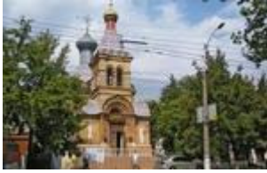
Рис.16 Зображення церкви Святої Мучениці Олександри, вул.Перекопська, 3

Різдва Христа Спасителя (монастирсьок) пр.Ушакова,83,кв.83