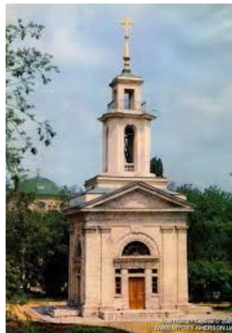
Рис.16 Дзвіниця собору

Західніше собору височіє триярусна дзвіниця, побудована в стилі класицизму. Вона споруджувалась тричі. Вперше - з 1800 по 1805 роки. Але будівля дала тріщину і похилилася. В 1806 році тимчасово поставили дерев'яну дзвіницю, але вона постраждала від пожежі. Третя, висотою до 26 метрів, була триярусною, з дзвоном у 112 пудів. Нині відреставрований лише нижній ярус.