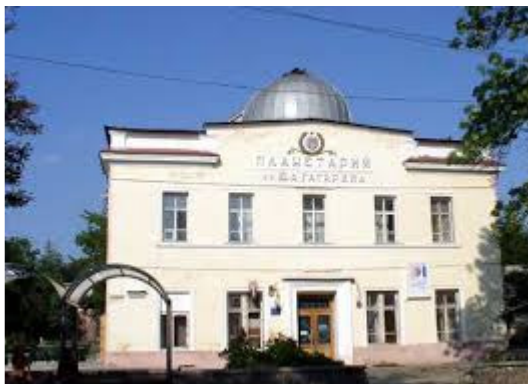
Рис.30. Планетарій,сьогодні вул. Комунарів, 14

До наших днів збереглася лише Велика Синагога, в якій знаходиться планетарій (вул., Комунарів, 14)