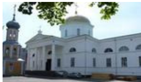
Рис.1 Зображення Свято-Духівського собора. 73025, вул.Декабристів 36