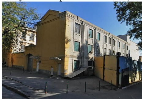
Рис.20. ТРК Скіфія, вул.Перекопська, 10

Після Лютневої революції каторжна в'язниця була ліквідована. Будинок колишнього арсеналу почергово займали то майстерні громадських робіт, то військова частина, або концтабір, а після відновлення у місті в січні 1920 р. радянської влади - "Допр" (будинок громадських примусових робіт). Церква вже не мала ніякого відношення до цих організацій. Переходи, що вели від основної будівлі до храму були перекриті. Ще 30 березня 1919 р., у відповідь на клопотання віруючих, Херсонська рада робочих і солдатських депутатів ухвалила перетворити Свято-Покровську церкву на виключно приходську. Проте ліквідаційна комісія з відокремлення церкви від держави на засіданні 22 вересня 1921 р. ухвалила рішення закрити храм. І, незважаючи на листи-звернення робітників різних підприємств Херсона (електрична станція, водопровідна майстерня, насосна станція, цех «Тяжеловоз») щодо збереження Свято-Покровської церкви, у 1921 р. вона була зачинена. З 1959 р. і до сьогодні в її приміщенні розташовується Херсонський телецентр.