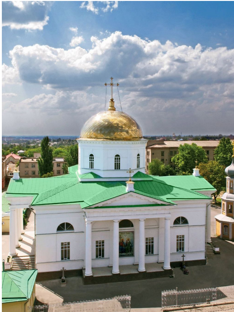
Рис.17 Свято-духівський кафедральний собор

Виконаний у простих геометричних формах, храм відрізнявся чіткою пропорційністю, чистотою плану, об'ємів, площин та деталей при одночасному їх поєднанні. Проект датований 1810 роком, проте будівництво церкви, висота якої мала становити 27 м, через постійний брак коштів тривала до 1836 р. В процесі будівництва циліндричний барабан храму було замінено на восьмикутний — простіший у виконанні. Завершенню будівництва храму сприяла пожертва у 15 тис. рублів «раба Божого Гр. І. Р.», як назвав себе благодійник.