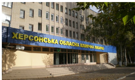
Рис. 26 Херсонська обласна клінічна лікарня

У 1995 р. храм у лікарні було відроджено - 18 липня освячено Свято-Сергіївську церкву. Зараз храм функціонує у спеціально відведеному приміщенні терапевтичного відділення обласної лікарні на тому ж поверсі будинку, що і раніш.