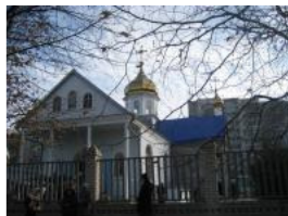
Рис. 6 Зображення церкви Знамення Божої Матері, вул.Димитрова

Різдва Пресвятої Богородиці (монастирськ)