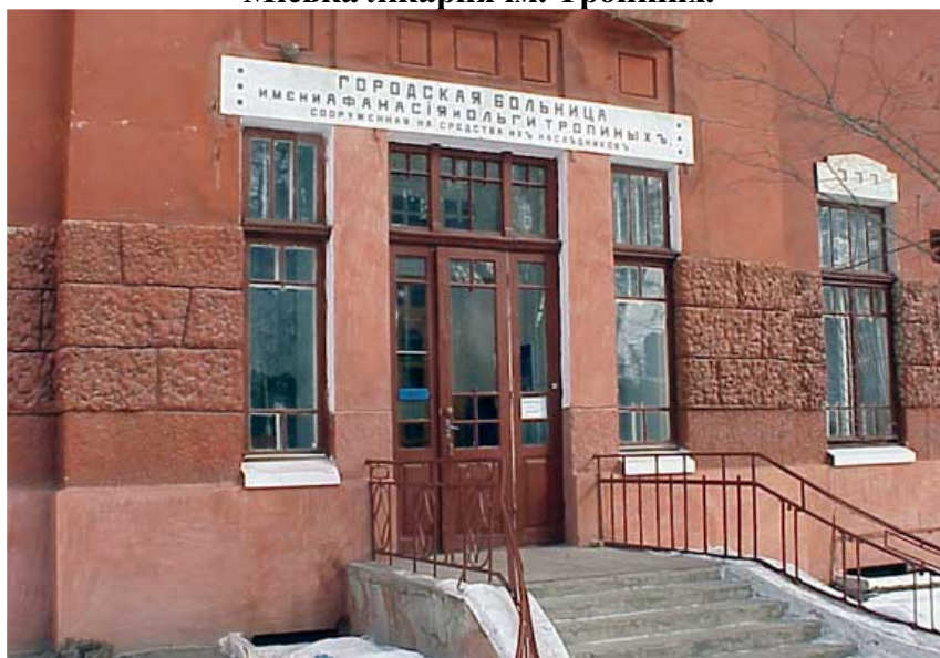
Рис.27 Міська лікарня ім. Тропіних