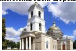
Рис.4 Зображення Свято-Миколаївської церкви, 73000, вул.Доброхотова, 31

Святого апостола Івана Богослова (Зеленівська)