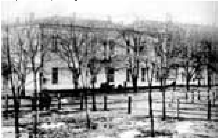
Рис.24 Богоугодний заклад. Почтова картка, Ізд.Я.Я.Мендельсон, 1908р

У 30-х роках ХІХ ст. по вул. Говардівській (нині - просп. Ушакова, 67) була збудована лікарня - Богоугодний заклад для "больных и призреваемых", перетворений, із введенням у 1864 р. у Херсонській губернії земських установ, у губернську земську лікарню.