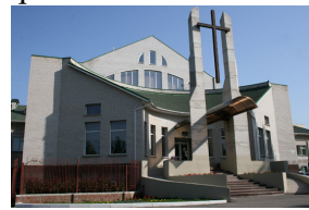
Рис. 19 Зображення Церкви Християн вул. 49 Гвардійської дивізії,31а

Громада ЄХБ с.м.т.Комишани, Комсомольського р-ну, пров. Східний, 146