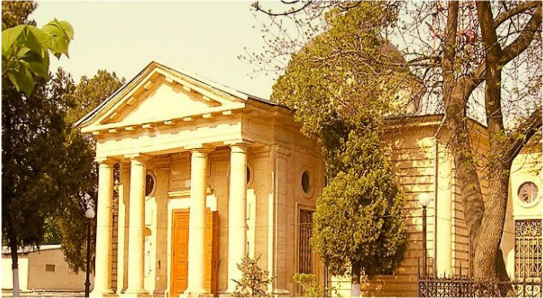
Рис.13 Свято-Катерининський собор

Нажаль, нині ми не можемо судити про іконостас храму в цілому і навіть про роботу майстра (художника XVIII століття Михайла Шибанова, з яким у 1783 році був підписаний контракт на створення іконостасу) загалом. Від колись рясно прикрашеного живописом та різьбленням іконостаса зараз залишилось всього одинадцять образів. Пошуки самого іконостаса чи якихось його фотозображень результатів не дали.