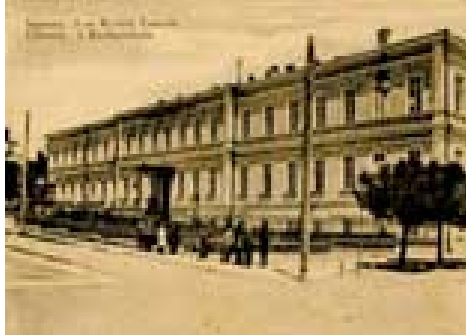
Рис.21. Перша чоловіча гімназія. Почтова картка. Ізд. Маркуса Заранкіна.1915р

Херсонська чоловіча гімназія (нині - гімназія № 20).