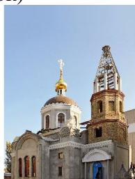
Рис. 7 Зображення церкви Різдва Пресвятої Богородиці. вул.Червонофлотська.,29

Різдва Пресвятої Богородиці (монастирськ)