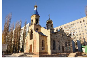
Рис. 10 Зображення церкви Свято-Касперівської ікони Божої Матері, вул.Дорофеева,17