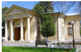
Рис.2 Зображення Спаського(Свято-Катерининського) собора 73000, вул.Перекопська, 13