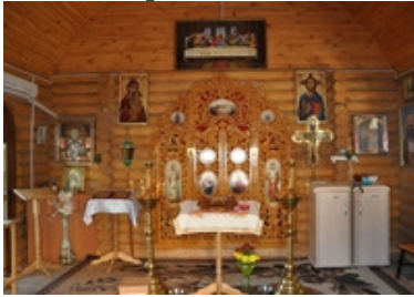
Рис. 11 Зображення Церкви Святого Інокентія Херсонського Херсон, вул. Фонвізіна. 1