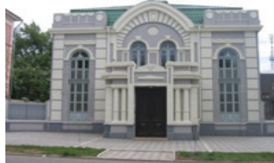
Рис.23 Зображення Херсонської Синагоги