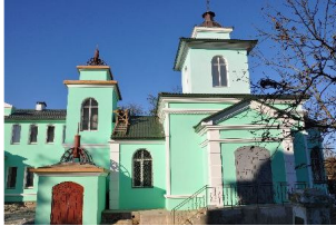
Рис. 9 Зображення церкви Різдва Богородиці, сел.Кіндійка