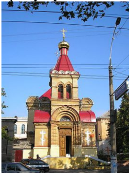
Рис.23 Церква Св. Олександри