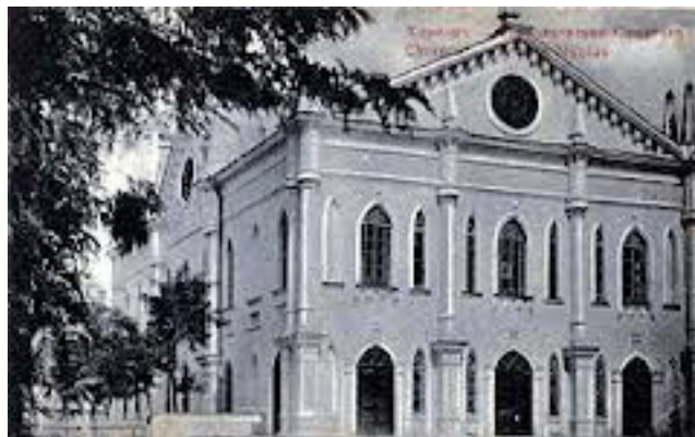
Рис. 29 Миколаївська Синагога, Фототипія Шерер, Набгольц і Ко, 1902р

Головну Єврейську Синагогу було збудовано у 1840 році у стилі пізнього класицизму за проектом архітектора Карла Акройда (1787-1855рр). Поруч з головною синагогою знаходились ще дві: Велика (Стара) та Мала.