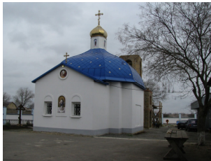
Рис. 13 Зображення Свято-Благовіщенської церкви, 73490, с.м.т. Комишани