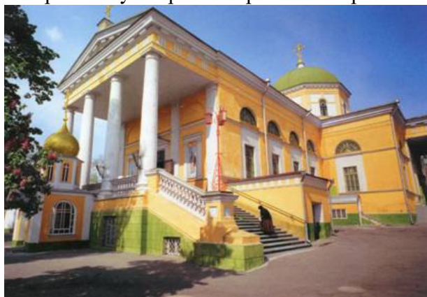
Рис.19 Свято-духівський собор

Після повернення храму віруючим у серпні 1944 року, він поступово відновлювався. У 1947 року Свято-Духівська церква стала кафедральним собором, де сьогодні знаходиться кафедра архієпископа Херсонського і Таврійського, який очолює Херсонську єпархію Української православної церкви.