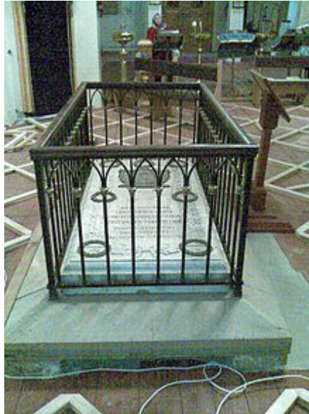
Рис.15 Пам'ятник-плита князю Потьомкіну

Західніше собору височіє триярусна дзвіниця, побудована в стилі класицизму. Вона споруджувалась тричі. Вперше - з 1800 по 1805 роки. Але будівля дала тріщину і похилилася. В 1806 році тимчасово поставили дерев'яну дзвіницю, але вона постраждала від пожежі. Третя, висотою до 26 метрів, була триярусною, з дзвоном у 112 пудів. Нині відреставрований лише нижній ярус.