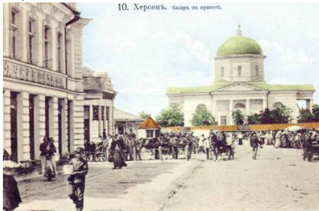
Рис.18 – Свято-духівський собор. Почтова картка