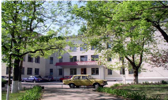
Рис.28 Міська лікарня ім. Тропіних

12 (25) січня 1914 р. відбулося офіційне відкриття міської лікарні імені Тропіних. У її дворі знаходилась каплиця, яка не збереглася до нашого часу. Можна припустити, що вона припинила своє існування в перші роки радянської влади. З 2003 р. при лікарні відновлено функціонування храму, який освячений в ім'я образу Пресвятої Богородиці, званої Цілителька (храм належить до парафії св. Варвари) і діє в одноповерховій споруді на території лікарняного комплексу.