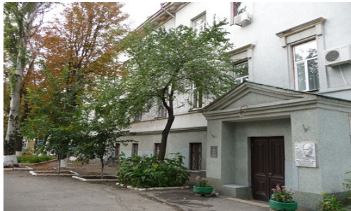
Рис.25 Херсонська обласна лікарня