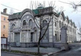
Рис. 20 Зображення храму ХАБАТ вул. Горького, 29