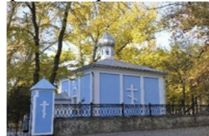
Рис.12 Зображення церкви «Всіх скорботних радість». вул. Кримська, 138