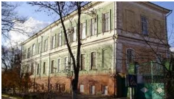
Рис.22 - Гімназія №20

12 березня 1815 р. у місті була відкрита губернська чоловіча гімназія, для якої у 1863 р. за проектом губернського архітектора Л.Є.Тоннеса було збудоване нове приміщення у Дніпровському провулку (сучасний провулок Д.Любарської, між вулицями Леніна та Дзержинського). У 1867 р., за сприянням губернатора П.М.Клушина (першого Почесного громадянина міста Херсона), на відзначення спасіння життя імператора Олександра II 4 квітня 1866 р., при гімназії була зведена церква св. Олександра Невського (освячена 9 (22) квітня 1867 р., перший настоятель -учитель Закону Божого о. Георгій Вуколов). Це була домовна церква - одноповерхова будівля храму була однаковою за висотою з двоповерховою гімназією і логічно її продовжувала, створюючи єдиний комплекс. У 1922 р. Олександро-Невська церква вже не функціонувала. Її приміщення було переобладнане у спортзал, який зараз належить гімназії № 20.