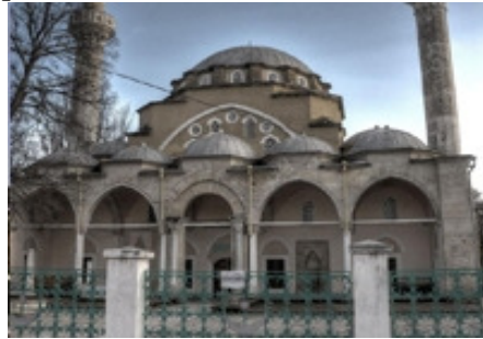
Рис. 12 Зображення Херсонської Мечеті Херсон, вул. 50 років Жовтня, 26

Згідно з інформацією електронних джерел, присвячених туризму в Херсоні, найвідвідуванішими вважаються Свято-Духівський та Свято-Катерининський собори. Надамо детальнішу інформацію про зазначені культурні споруди.