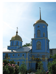
Рис. 8 Зображення церкви Різдва Богородиці, 73025,вул.Червонофлотська, 13