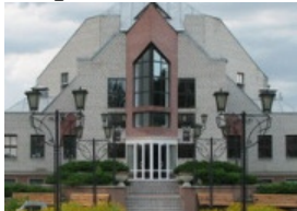
Рис. 18 Зображення ЄХБ «Голгофа» вул.Будонного.7

Церква Христа Спасителя вул.Ілліча, к-т «Шумен»