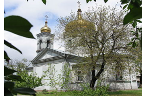
Рис17 Зображення церкви Срітіння Господнього, 73011, вул.Енгельса. 45

Громада ЄХБ «Церква Бога Живого» 73012, вул.Комкова, 92, кв.13