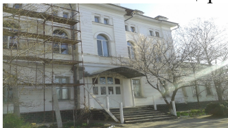
Рис. 15 Зображення Свято-Пантелеймонівської церкви, 73488, с.м.т. Степанівка, вул.. Ракетна,55