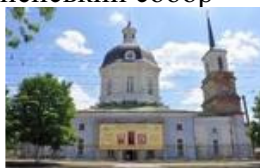
Рис.3 Зображення Свято-Успенського собора,73000, вул. Леніна, 5