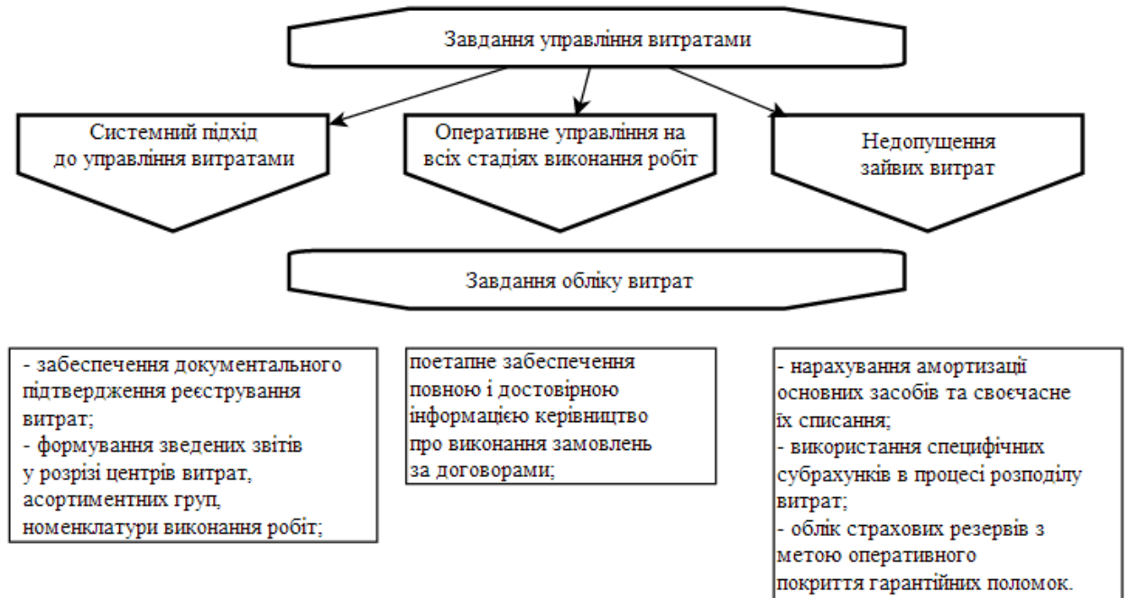
Рисунок 2 – Завдання управління та обліку витрат

Враховавши особливості для підприємств промисловості сформовані завдання управління витратами та основні завдання обліку витрат (рисунок 2).