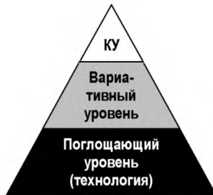
Рисунок 1 – Уровни возможностей команды проекта

К сожалению, если каждый серийный проект является лишь звеном в цепи однотипных, при каждом переходе от проекта к проекту вариативный и, особенно, креативный уровни постепенно замещаются поглощающим так, что, начиная с некоторого момента остается «чистая» технология, проект как бы трансформируется в операционную деятельность – проект перестает быть уникальным и задачи творческого управления проектом сводятся к нулю (рис. 2).