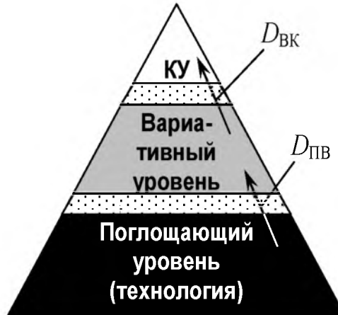
Рисунок 4 – Диффузионные слои между уровнями возможностей команды проекта

нестабильность среды проекта, нацеленность действующей нормативной базы на повышение уровня унификации технических и технологических решений и многое другое.