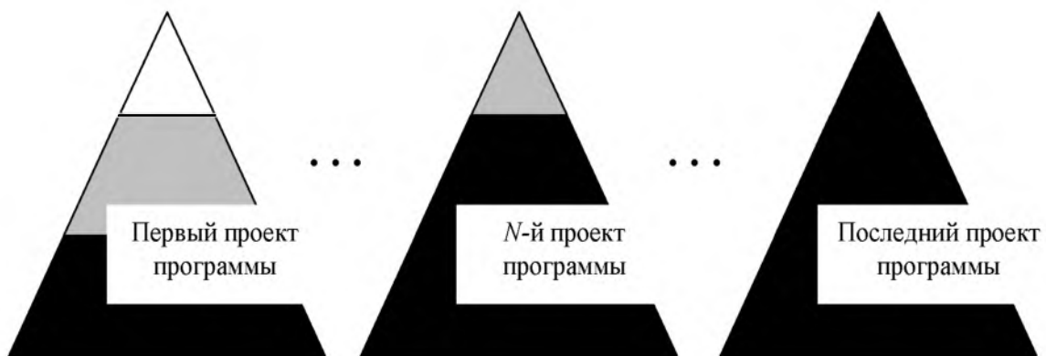
Рисунок 2 – Процесс накопления доли операционной деятельности при выполнении программы, состоящей из серийных проектов

Например, если речь идет о строительстве, управление первым проектом на стадии инициации может включать исследование и выбор метода подъема строительных конструкций и материалов на верхние этажи на креативном уровне и выбор конкретного подъемного устройства на вариативном. На последующих же проектах подъемное устройство