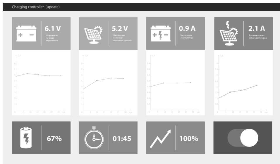
Рисунок 2 – Веб-интерфейс

отображаются в реальном времени на LCD дисплее.