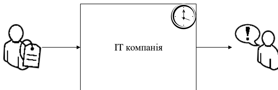
Рисунок 1 – Загальна схема навчання персоналу за методом навчання ротації

Особливості системи корпоративного навчання і розвитку персоналу пояснюються рисунками 1,2, причому на структуру системи впливає персонал НДІ ІКС та характер роботи працівників. В основу даної системи покладено два методи навчання – ротації (рис. 1) та кейсів (рис. 2).