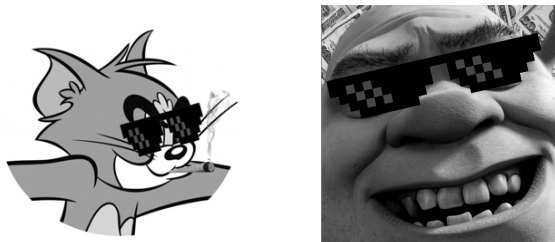
Рис. 1. Примеры аватарок с «пиксельными» очками

Впрочем, и эта мода в «реале» долго не продержалась, переключаясь в аватарки (рис. 1).