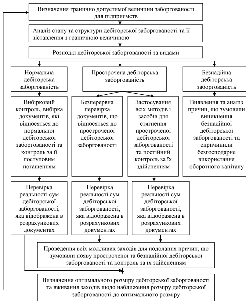
Рис. 1. Схема здійснення внутрішнього контролю за дебіторською заборгованістю приватного охоронного агентства в рамках надання охоронних послуг