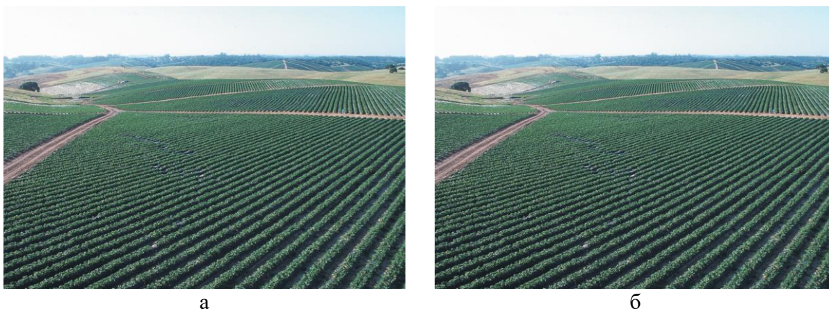
Рис. 3. Збереження надійності сприйняття стеганоповідомлення після вбудови в ЦЗ конфіденційної інформації розробленим android-додатком: а – ЦЗ-контейнер; б – стеганоповідомлення

Тестування розробленого стеганомесенджеру на 100 ЦЗ розміру 3100 \times 4200 пікселів дали наступні результати. Порушення надійності сприйняття формованих стеганоповідомлень, яка встановлювалася за допомогою суб'єктивного ранжирування, зафіксовано не було. Як ілюстрація цього на рисунку 3 наведений типовий приклад застосування розробленого стеганододатку до одного з використаних в якості контейнера зображень.