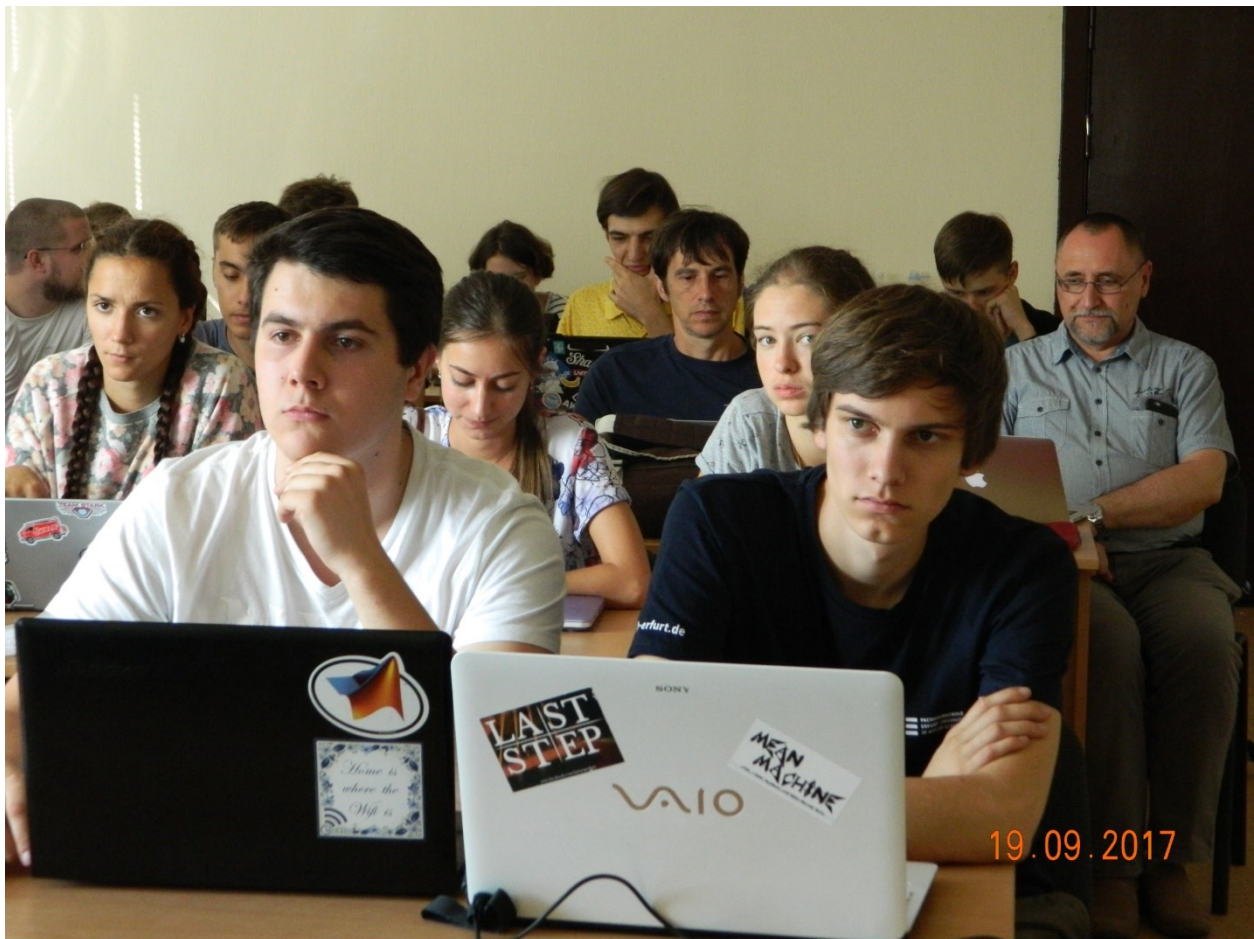
Студенты на занятия Летней школы

По опыту проведения летних школ, можно уверенно утверждать, что они есть одним успешным звеном в плане выполнении международных студенческих проектов, а также уникальным опытом международной командной работы для всех участников. Мы уверены, что летние школы являются шагом на пути к плодотворной кооперации, взаимопониманию, сплочённости и искренней дружбе между их участниками.