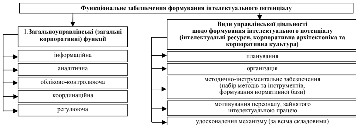
Рис.2 Зміст функціонального забезпечення формування інтелектуального потенціалу промислового підприємства

Реалізується функціонал бізнес-партнерства виконанням заходів за обраними маршрутами розвитку інтелектуального потенціалу, формування їх спільного / автономного бюджету.