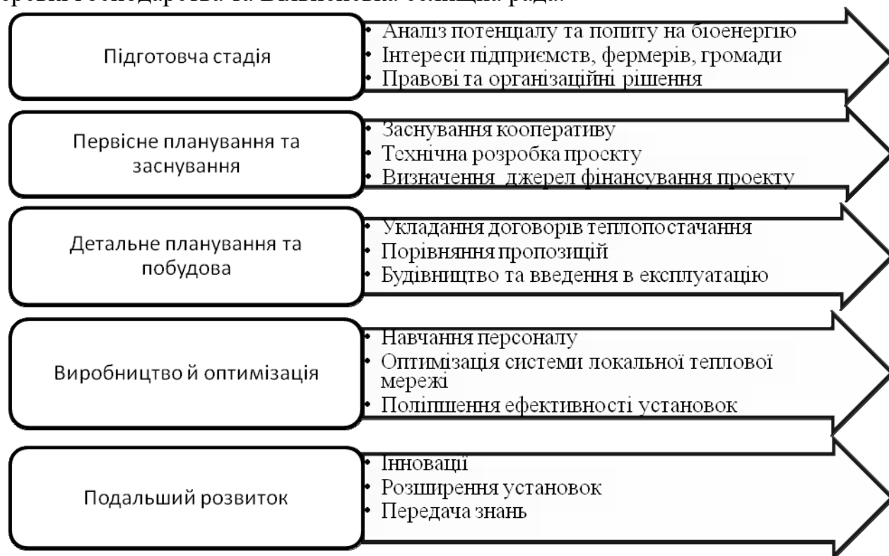
Рис. 1. Стадії реалізації проєкту біоенергетичного селища на основі коопераційної взаємодії промислових підприємств, фермерських господарств та селищної ради (складено за [4])

турбінний завод «Констар», ПрАТ «Криворізький міськмолкозавод № 1», фермерські господарства та Вільненська селищна рада.