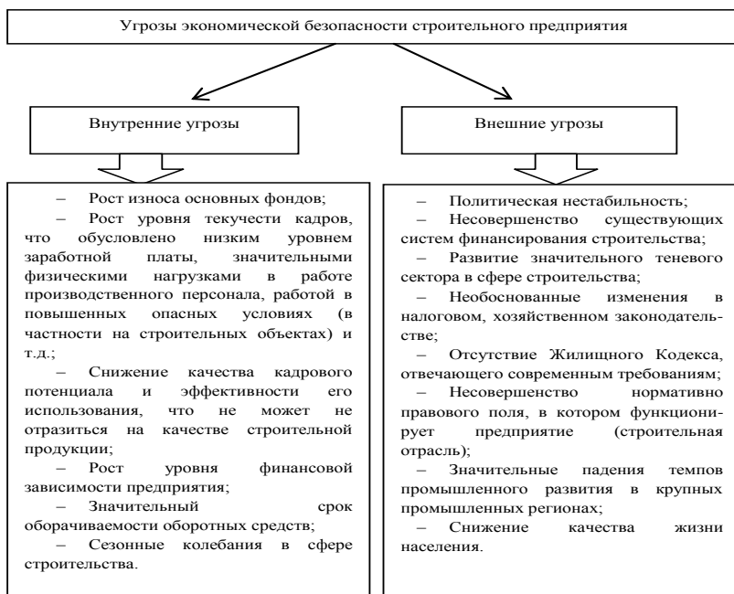
Рис. 2. Классификация угроз экономической безопасности строительного предприятия [14, с.137]

В мировой практике стратегического планирования широко используется метод разработки сценариев развития событий. Его можно использовать и для прогнозирования состояния экономической безопасности предприятия. Этот метод является комбинацией экспертных методов и методов моделирования. Метод разработки сценариев развития событий по обеспечению безопасности предприятия выступает как инструмент четкого определения и понимания возможных альтернатив развития состояния экономической безопасности конкретного предприятия и окружающей его среды в будущем, а также разработки соответствующих мер по исправлению положения экономической безопасности [6, с.81].