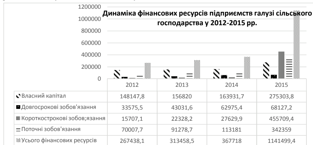
Рис. 2. Динаміка фінансових ресурсів підприємств галузі сільського господарства у 2012-2015 рр. [9]

Дані рис. 3 висвітлюють чітку тенденцію до значного зросту поточних зобов'язань у порівнянні з досить повільним зростом довгострокових зобов'язань. Це є негативною тенденцією, адже залучення саме довгострокових ресурсів, за умови ефективного їх використання, дозволяє досягнути значні позитивні економічні зсуви, у тому числі, у напрямку покращення фінансових результатів сільськогосподарських підприємств.