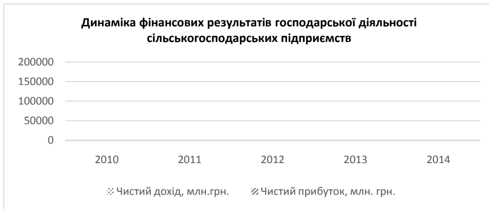
Рис. 1. Динаміка фінансових результатів господарської діяльності сільськогосподарських підприємств [9]

Обсяг забезпечення фінансовими ресурсами сільськогосподарських підприємств на протязі 2012–2015 рр. демонструє стабільне зростання – на 874061,3 млн. грн. У 2015 р. спостерігається суттєвий приріст короткострокових та поточних зобов'язань у порівнянні з досить незначним приростом довгострокових зобов'язань, що не можна віднести до позитивної тенденції.