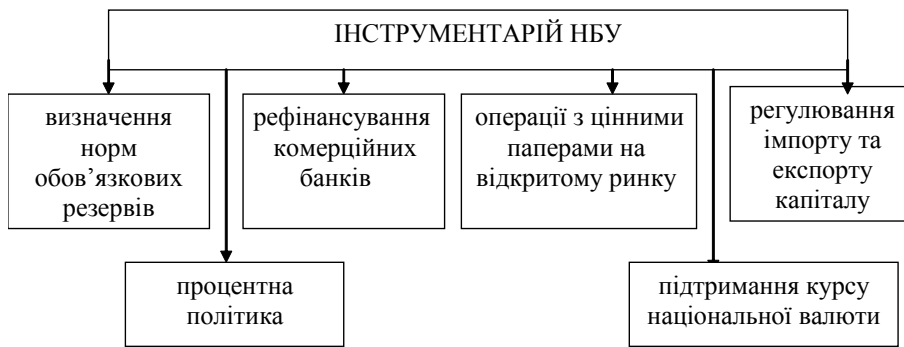
Рис. 1. Інструментарій грошово-кредитної політики НБУ

рушення банком або іншою установою банківського законодавства України, нормативних актів НБУ, проведення ризикових операцій, які загрожують інтересам вкладників та кредиторів, НБУ має право вимагати усунення виявлених порушень [6, с. 101—106].