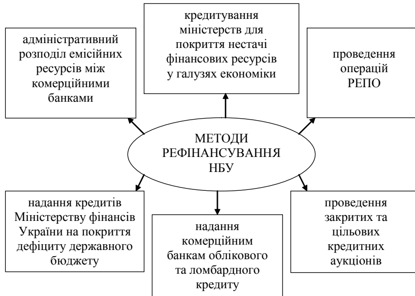
Рис. 2. Методи кредитування Національного банку України

винної безготівкової (кредитної) емісії, що дає підстави вважати облікову ставку ціною грошей, на яку орієнтуються всі суб'єкти грошового ринку.